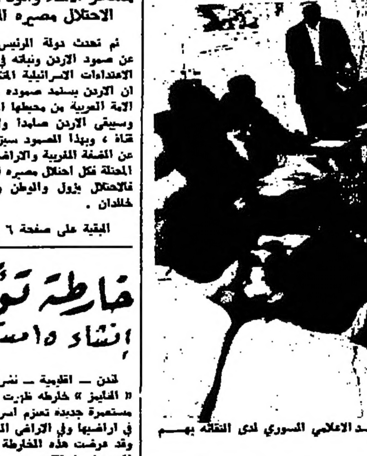
دولة السيد بهجت التلهوري رئيس الوزراء يتحدث الى اعضاء الوفد الاعلامي السوري لدى التلقاه بهم صباح أمس

ضارطة تؤكد مطامع اسرائيل انشاء واستعمرة جديدة بالمناطق المحتلة انه سيكون موضوع مغفوضات واذا كان هناك شك حول مستقبل مرفعات الجولان فان المغارطة نزل هذا الشك . وتنضم الصحبة بالقول ان يد واضح المغارطة توفر جبالاً تزيد من التكتلات ويستاء ثناء السويس التي لم تحدد المغارطة وضمان الحدود الدولية فيها تظهر في محاذة خطوط وقف إطلاق النار !